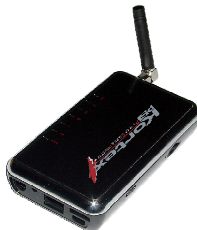
Kx GPRS M2M I-Net X095M2M

Dans le cadre de la monétique, la sécurisation des transactions bancaires est assurée par le protocole SSL V3 présent dans les terminaux de paiement IP. Notre routeur Kx GPRS M2M I-net est donc totalement indépendant des équipements monétiques en place, et parfaitement compatible avec l'ensemble des solutions monétiques IP du marché.