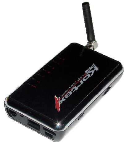
Kx GPRS M2M I-Net X095M2M

Dans le cadre de la monétique, la sécurisation des transactions bancaires est assurée par le protocole SSL V3 présent dans les terminaux de paiement IP. Notre routeur Kx GPRS M2M I-net est donc totalement indépendant des équipements monétiques en place, et parfaitement compatible avec l'ensemble des solutions monétiques IP du marché.